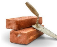
Planen & Bauen