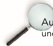
Aufsicht über Kommunen und Kreise