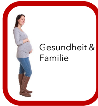
Gesundheit & Familie