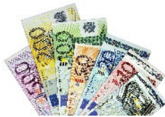
Finanzen & Wirtschaft