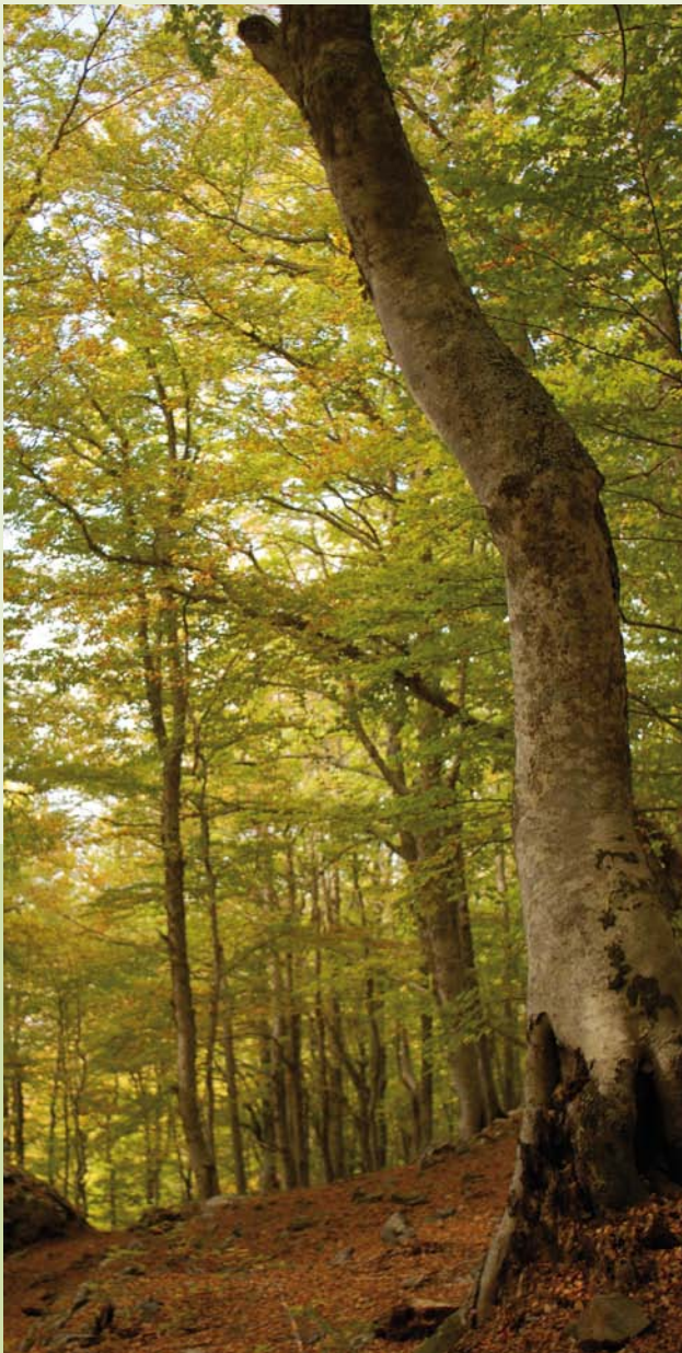
Die Rotbuche ( Fagus sylvatica ) ist ein bedeutender Forstbaum. Sie wird für 26 HKG nach FoVG angeboten.