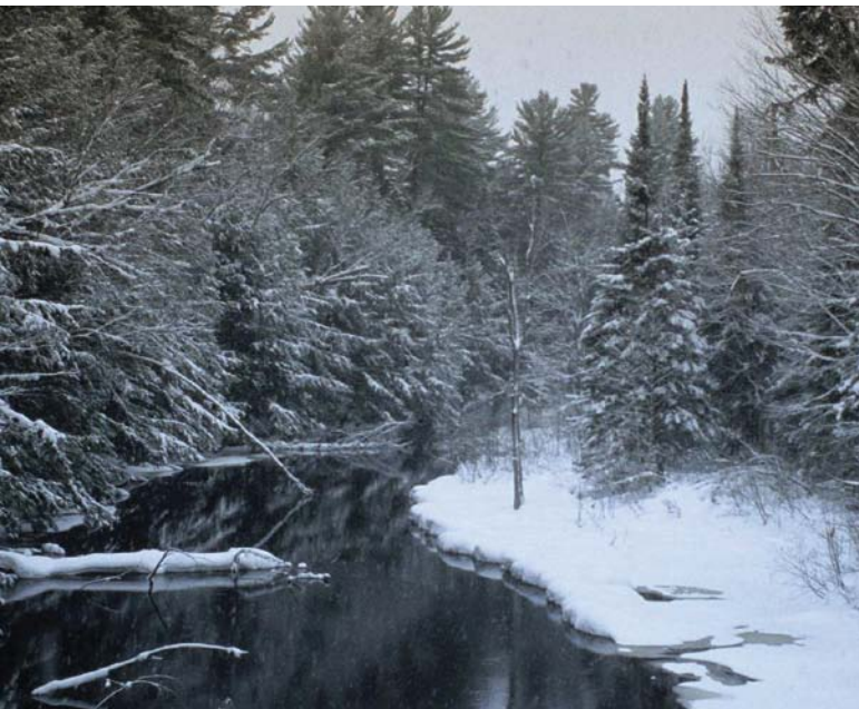
Klimatische, hydrologische und weitere Faktoren beeinflussen die Gehölzbestände.

Verbindliche Herkunftsgebiete werden für Forstbaumarten 4 durch das Forstvermehrungsgutgesetz (FoVG) und die Verordnung über Herkunftsgebiete für forstliches Vermehrungsgut (Forstvermehrungsgut-Herkunftsgebietsverordnung – FoVHGv) festgelegt. Das FoVG regelt aber nur die Erzeugung und das Inverkehrbringen von Forstvermehrungsgut. Für die Verwendung haben die Länder für die Forstwirtschaft Herkunftsempfehlungen erarbeitet, die im Staatswald und zum Teil auch bei staatlich geförderten Maßnahmen im Kommunal- und Privatwald verbindlich sind und ansonsten empfehlenden Charakter haben. Der Anwendungsbereich der forstlichen Herkunftsgebiete wurde für die dem FoVG unterliegenden Baumarten in Brandenburg über den forstlichen Bereich hinaus auf die freie Natur ausgedehnt.