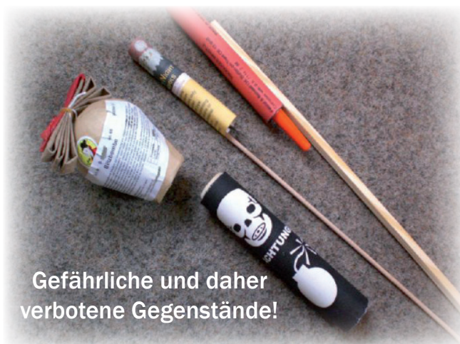
Gefährliche und daher verbotene Gegenstände!

Lagern Sie die pyrotechnischen Gegenstände an einem kühlen und trockenen Ort (in Wohnräumen max. 1 kg netto, in nichtbewohnten Räumen max. 10 kg netto. Davon jeweils max. 20% ohne zugelassene Verpackung.).