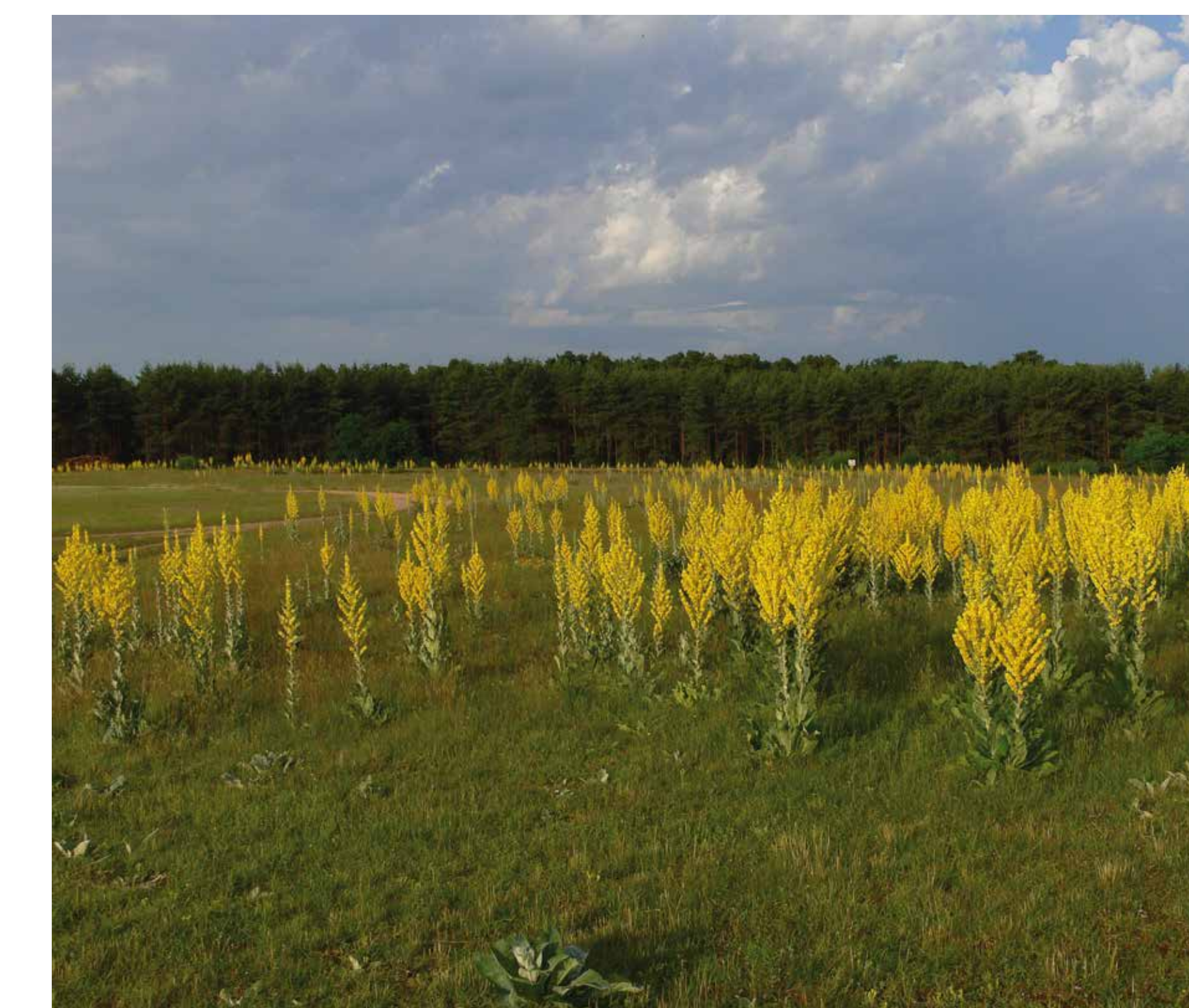
Die Flockige Königskerze ( Verbascum pulverulentum ) ist eine floristische Besonderheit des Gebietes.