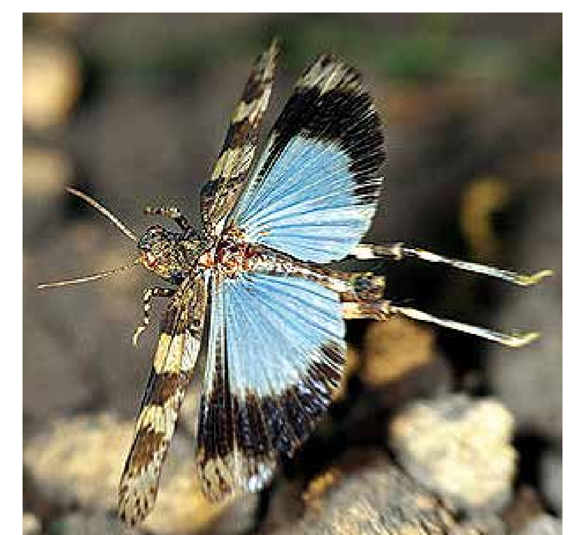
Die Blaüflügelige Ödlandschrecke ( Oedipoda caerulea ) zeigt erst im Sprung ihre wahre Schönheit.

NATURA 2000-Gebiete dienen dem Schutz von bedrohten Tier- und Pflanzenarten und ihren Lebensräumen. Dieses Ziel kann nur durch Ihre Mithilfe erreicht werden!