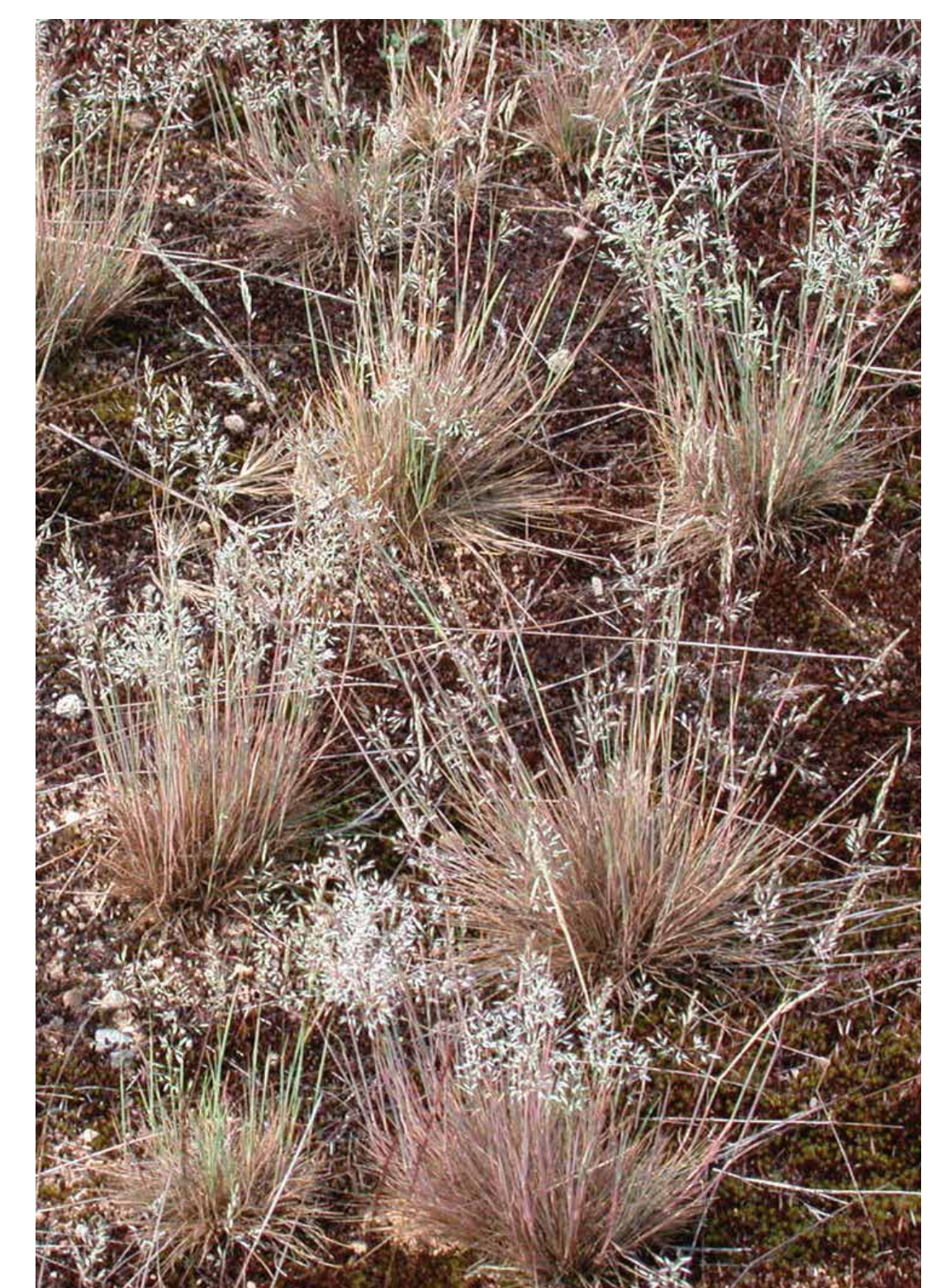
Eine Besonderheit der extrem trockenen Standorte ist das seltene Silbergras ( Corynephorus canescens ). Hier ist ein konsolidiertes, moosreiches Stadium zu sehen.