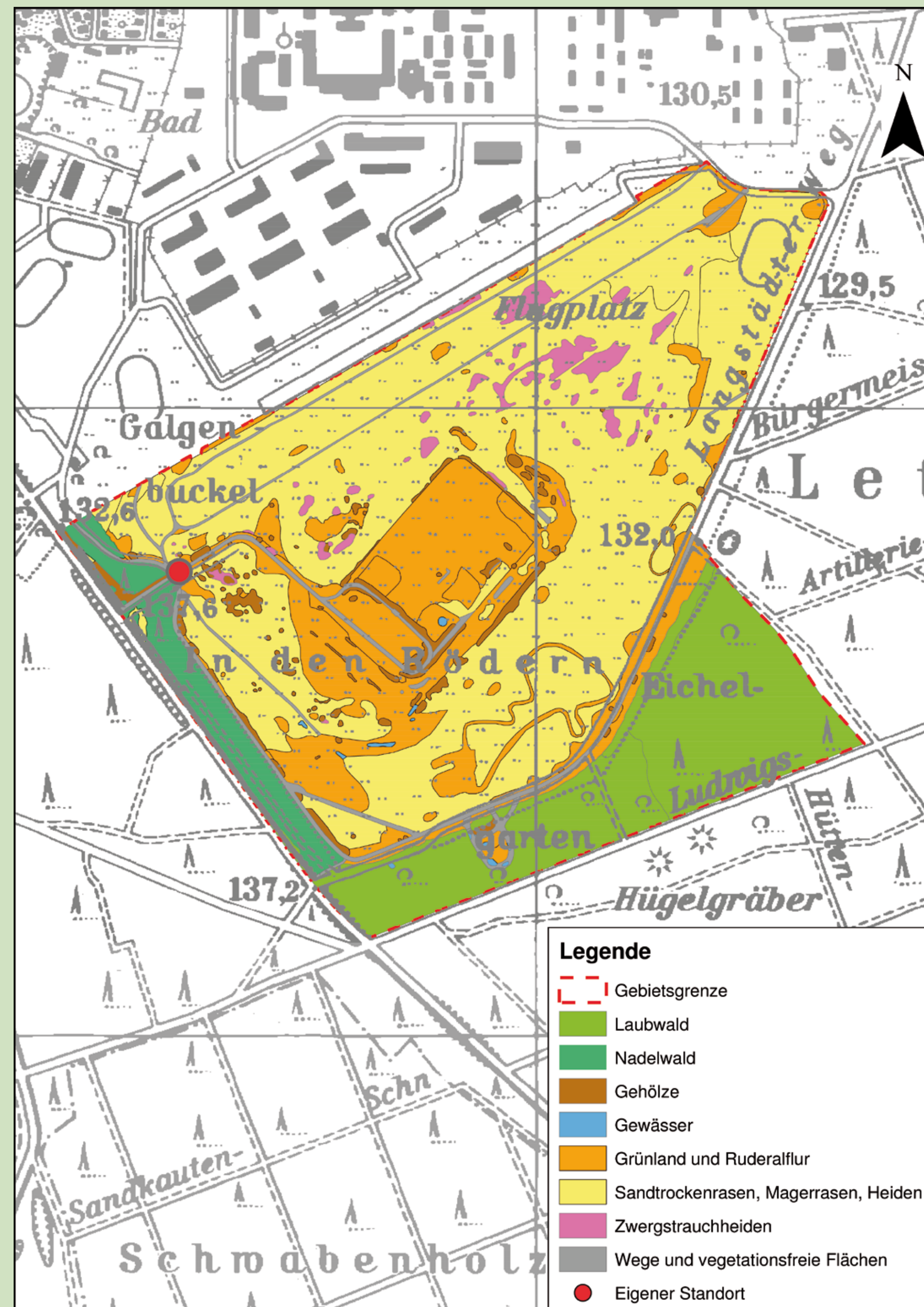
Datengrundlage: Topographische Karte 1:25000 (TK 25), mit Genehmigung des Hessischen Landesamtes für Bodenmanagement und Geoinformation (HLBG)