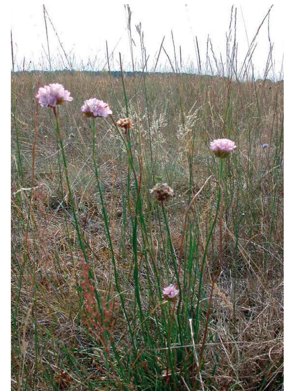
Durch die Pflegemaßnahmen der letzten Jahre hat sich der Bestand der Sand-Grasnelke ( Armeria elongata ) deutlich verbessert.