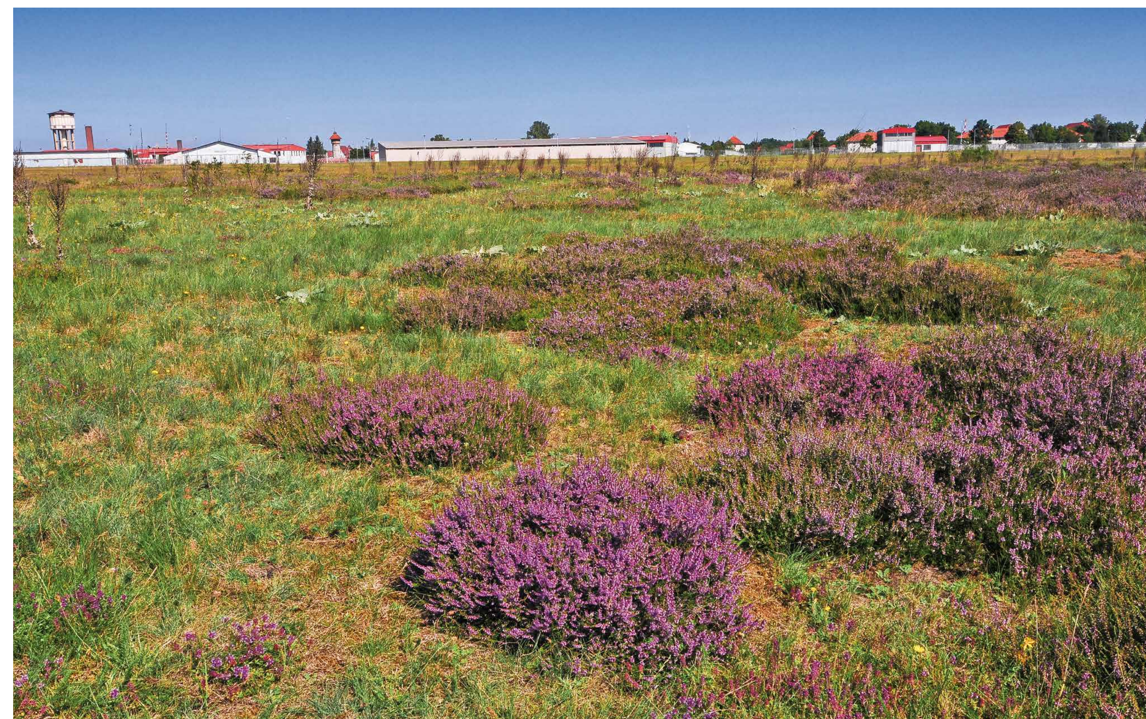
Zwergstrauchheiden bieten dem Betrachter im Sommer ein farbenfrohes Bild.

Die ursprüngliche Heimat der Przewalski-Pferde , der Urform des Wildpferdes, sind die weiten Steppen der Mongolei. Seit 1970 jedoch gilt das Przewalski-Pferd in der freien Wildbahn als ausgestorben. Die Tiergruppe im Natura 2000-Gebiet gehört zu einem europäischen Erhaltungszuchtprogramm, das die Wiederansiedlung der Tiere in ihrer zentralasiatischen Heimat zum Ziel hat. Bis es soweit ist, haben die wegen ihrer Genügsamkeit und Anpassungsfähigkeit an eine karge Vegetation bekannten Tiere als Landschaftspfleger eine wichtige Aufgabe. Sie sollen helfen, die seltenen Sandtrockenrasen als Lebensraum zu bewahren. Sie halten die Vegetation kurz und verhindern, dass sich Gehölze ausbreiten. Ihr Tritt und die typischen Sandbäder führen zu Bodenverwundungen, die für zahlreiche seltene Tier- und Pflanzenarten von großer Bedeutung sind.