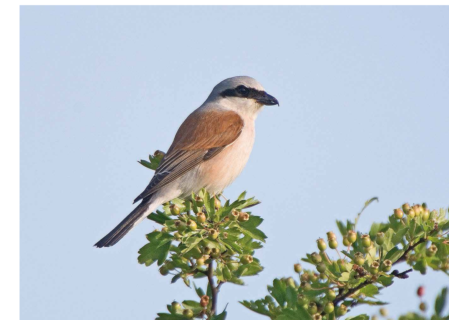
Der Neuntöter ( Lanius collurio ) sitzt gerne auf Warten. Seine Beute – Insekten, aber auch Kleinsäuger – speißt er auf Dornen auf. Dornige Hecken gehören daher zu seinem Lebensraum.