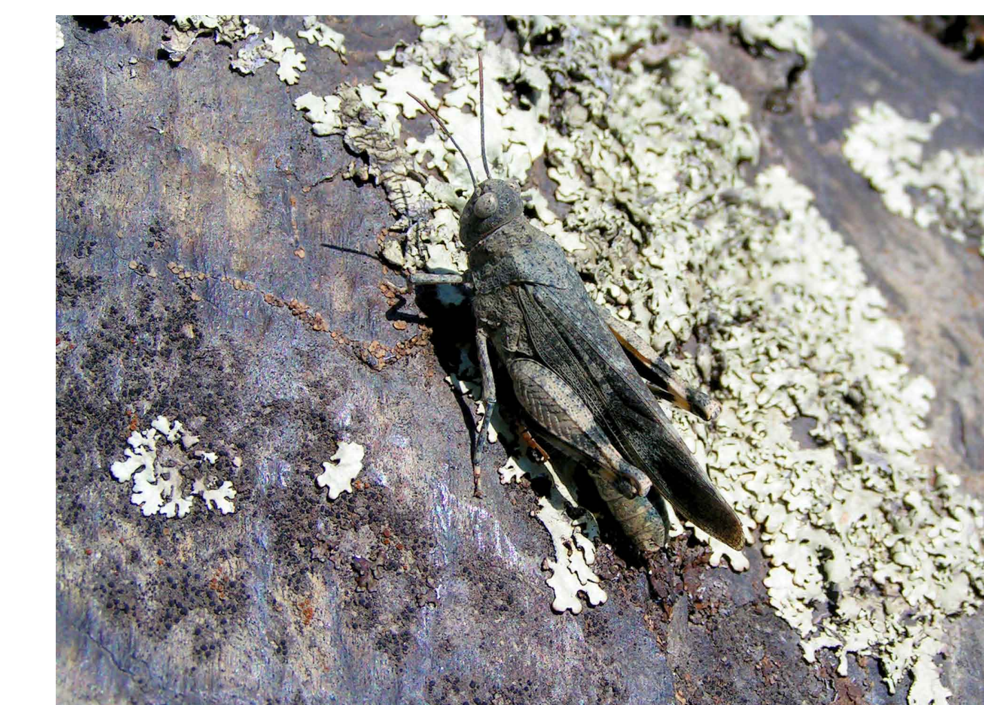
Die Rotflügelige Ödlandschrecke ist vom Aussterben bedroht. Auf den Fels- und Schotterflächen ist sie bestens getarnt, doch im Flug erkennt man sie leicht an den roten Unterflügeln.