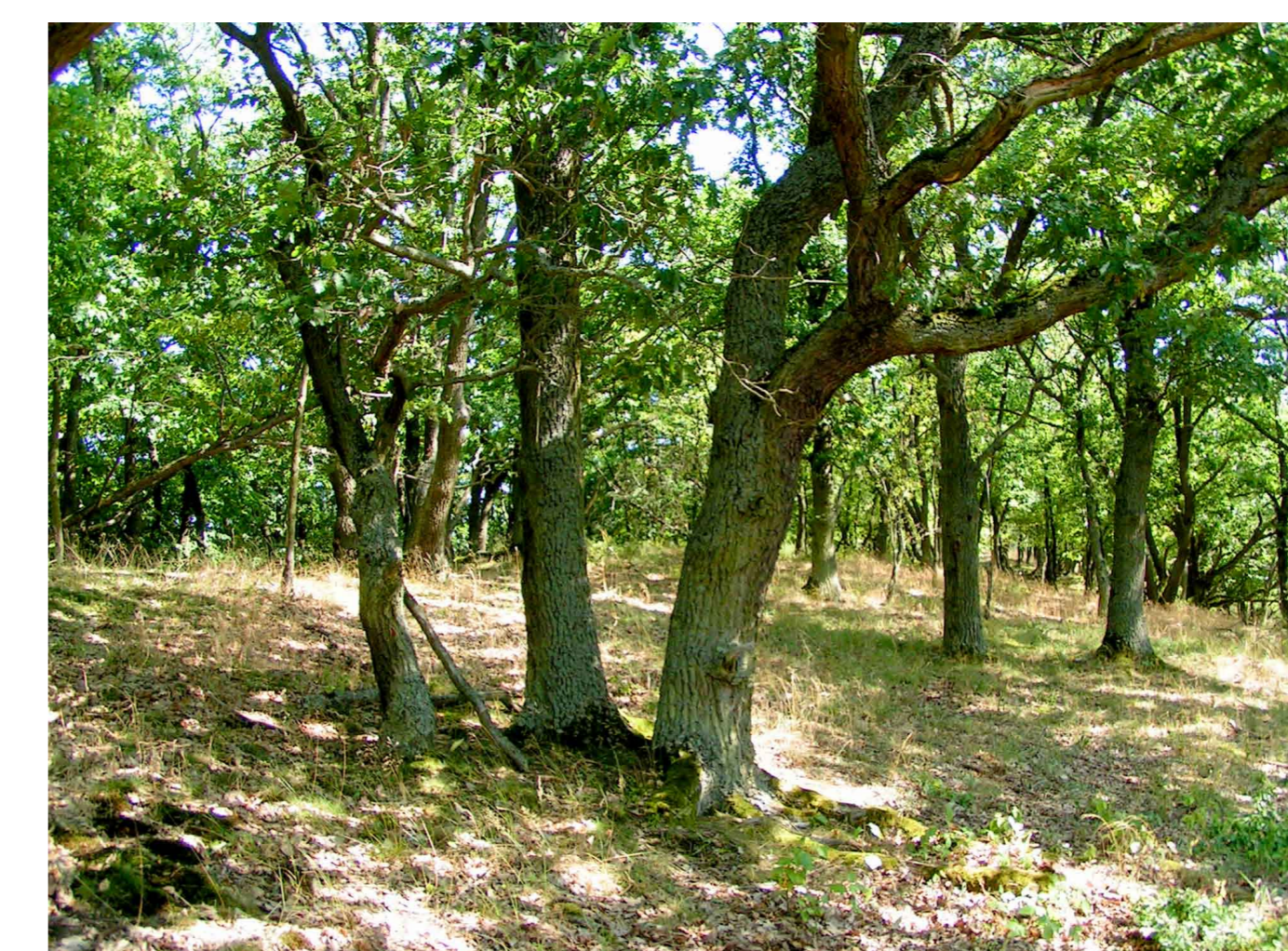
Sonnendurchflutete Traubeneichenwälder sind eine Besonderheit des mittleren Rheintals mit seinem milden Klima und trockenwarmen Böden.