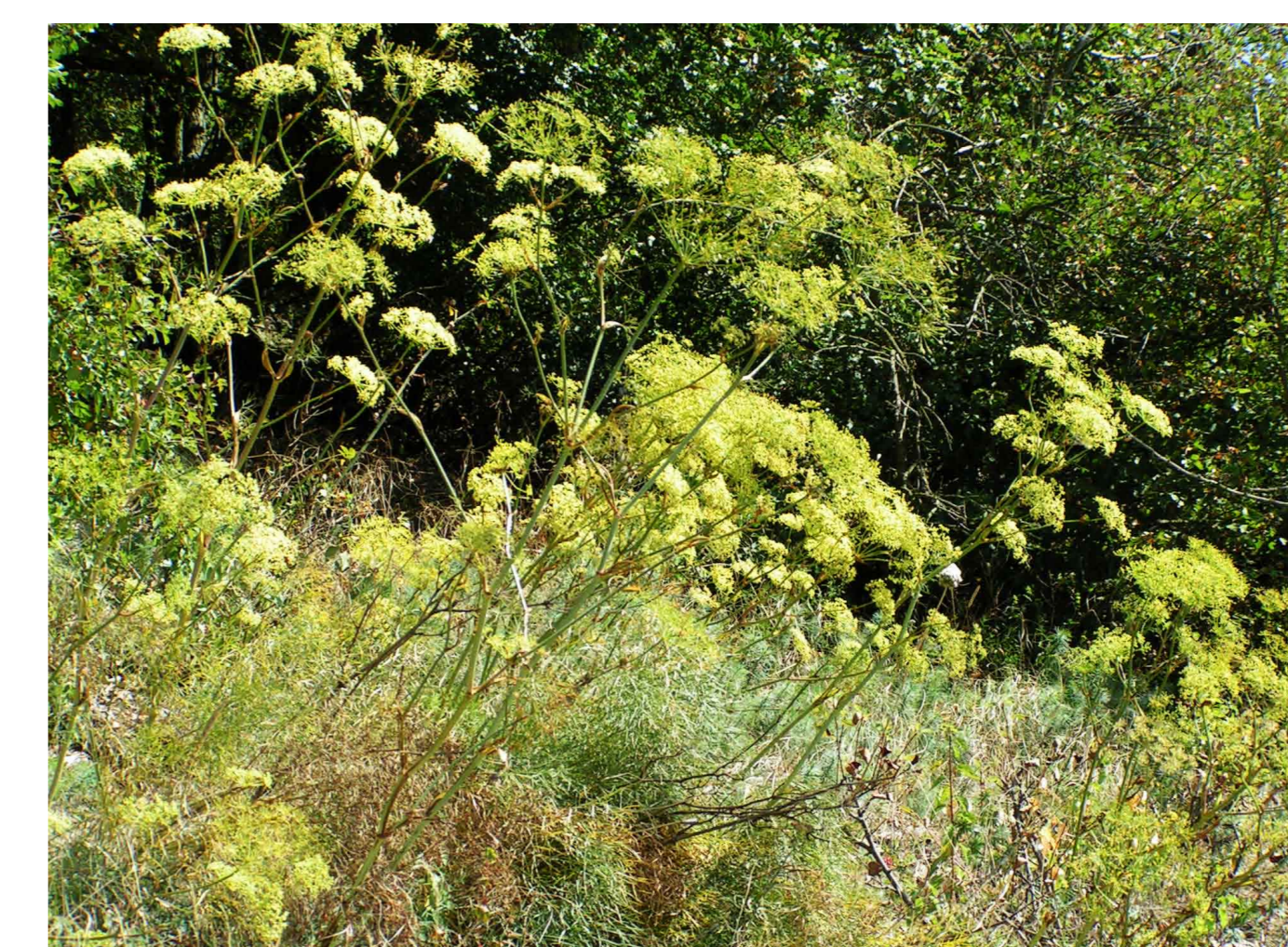
Der Echte Haarstrang schmückt mit seinen Dolden wärmeliebende Säume und Wegränder. Die frühere Arzneipflanze steht heute als gefährdete Art auf der Roten Liste.