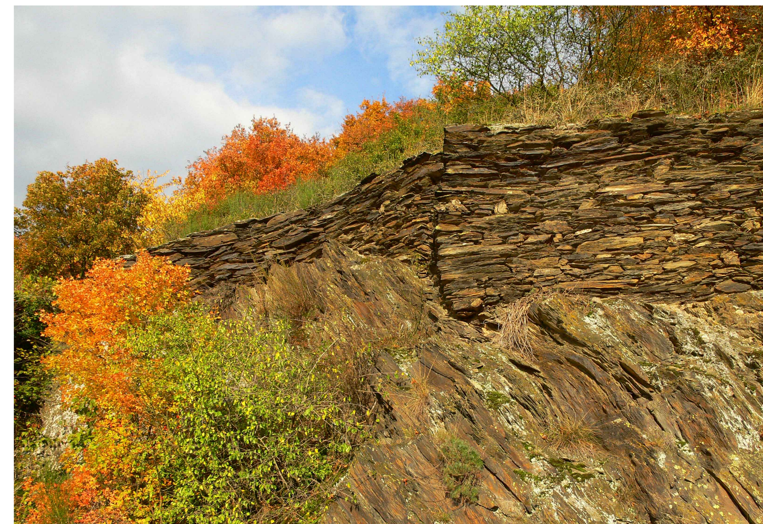
Steile Felshänge und meisterhaft eingefügte Trockenmauern sind beeindruckende Landschaftselemente und Lebensraum für seltene Tier- und Pflanzenarten. Der Felsenahorn zeigt sich hier in prächtiger Herbstfärbung.

Zu den interessantesten Bereichen gehören die Felskuppen, Steinbrüche und Schutthalden. Sie sind teils natürlichen Ursprungs, teils Reste früheren Gesteinsabbaus. Hier haben sich Spezialisten angesiedelt, die an die extrem trocken-heißen Standortbedingungen bestens angepasst sind. Dazu zählen seltene Heuschreckenarten und eine eindrucksvolle Vielfalt von über hundert verschiedenen Flechten .