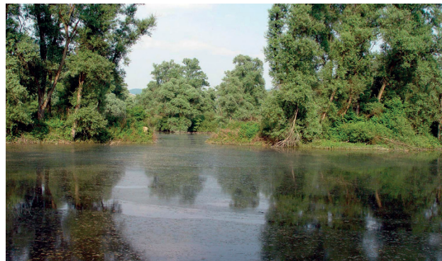
(9) Zeugen des Tonabbaus: Die flachen Stillgewässer sind ideale Lebensräume für Amphibien. Im flachen Wasser der Ufer gehen Watvögel auf Nahrungssuche.