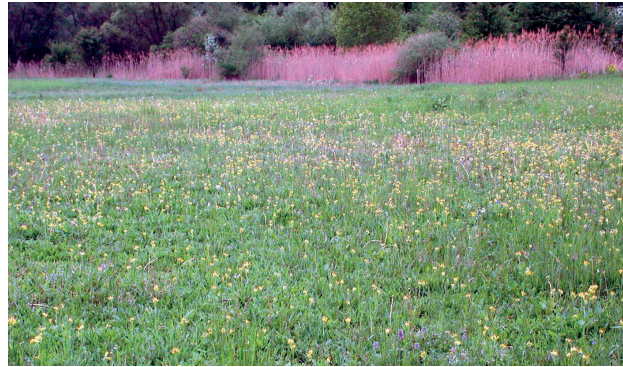
(8) Im zeitigen Frühling blühen im Naturschutzgebiet hunderte Wiesen-Schlüsselblumen .

Rund 90 Brutvogelarten konnten die ehrenamtlichen Gebietsbetreuer des NABU hier nachweisen. Darunter Zwergtaucher , Neuntöter , Eisvogel sowie viele Enten- und Greifvogelarten. Zu den Brutvögeln kommen – verteilt über das ganze Jahr – Nahrungsgäste wie Rohrweihe und Schwarzstorch sowie als Zug- und Wintergäste Grünschenkel , Waldwasserläufer und Silber-, Seiden- und Purpureiher . In den Tümpeln laichen verschiedene Frösche, Kröten und Molche, auch die Ringelnatter kann hier beobachtet werden.