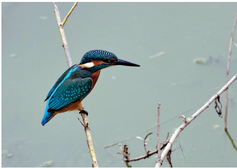
(2) Der Eisvogel ist gut an seinem bunten Gefieder zu erkennen. Pfeilartig taucht er nach kleinen Fischen.