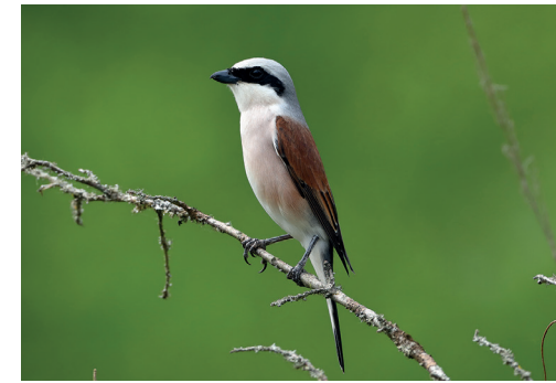
(4) Der Neuntöter bevorzugt die Hecken, dort speißt er seine Beute auf Dornen auf.