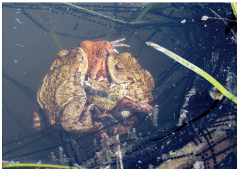
(3) Erdkröten laichen neben anderen Amphibienarten in den Stillgewässern.