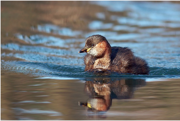
(7) Der Zwergtaucher ist mal über und mal unter Wasser unterwegs.