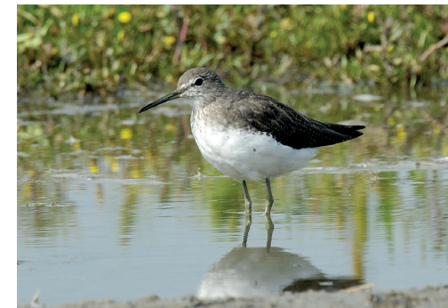
(5) Der Waldwasserläufer hat sein Brutgebiet in Skandinavien und Ostsibirien. Er macht hier Rast auf seinem Zug.