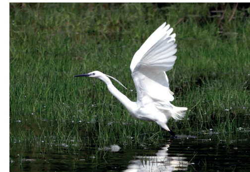
(6) Der Seidenreiher nutzt das Tongrubengelände zur Nahrungssuche.