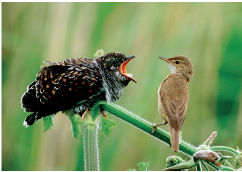
(1) Nicht selten werden Teichrohrsänger (rechts) unfreiwillig Eltern des Kuckucks .